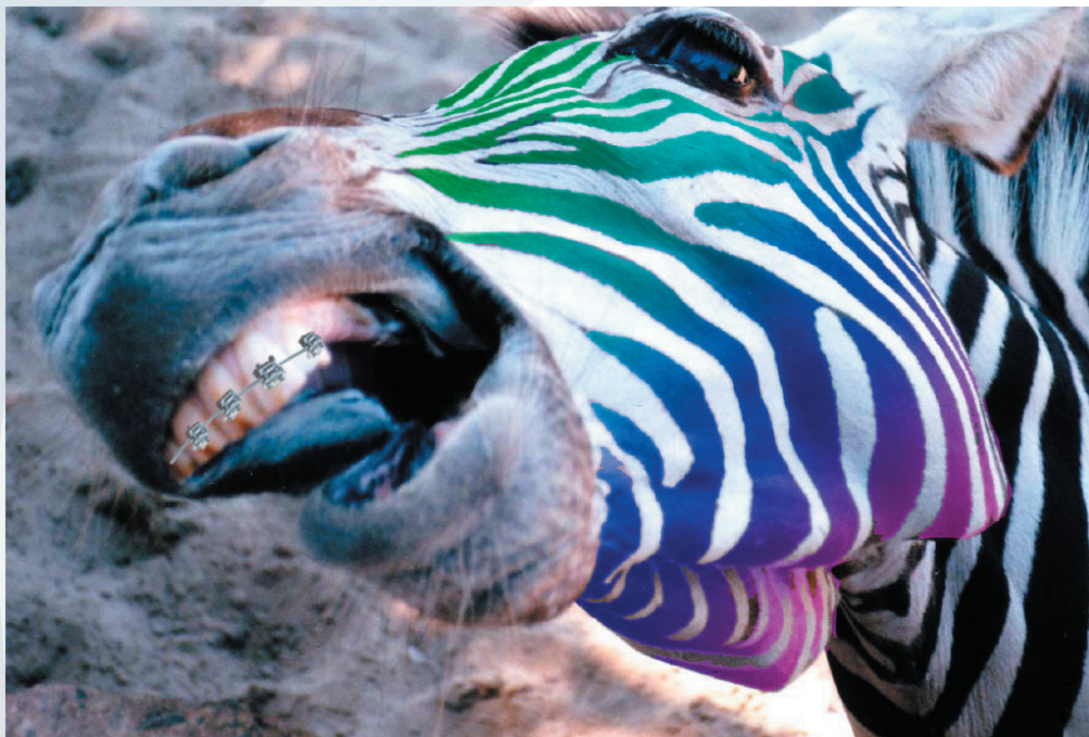
Le second patient, surnommé 'Orthodonkey'

«Notre second patient a contacté notre entreprise il y a de cela deux mois. Ce zèbre se plaignait de sa solitude trop pesante et de son incapacité à trouver l'élue de son coeur. Il ne se trouvait pas attirant, et complexait sur certaines parties de son corps. Nous avons donc concentré nos efforts sur sa dentition, ('proéminente' est un euphémisme) et les couleurs de sa robe, bien trop tristes et mornes.