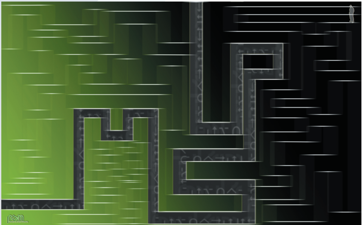
Le tout nouveau wallpaper

Le jury a donc rendu son verdict jeudi dernier, à Numérica, et c’est un jeune algérien de 21 ans qui a remporté le trophée. «Outre l’aspect graphique, nous avons apprécié la signification de cette création, et les idées positives et flatteuses qu’elle véhicule» explique un des jurés.