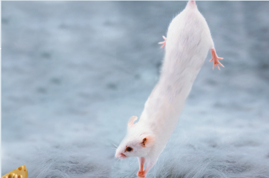
Le premier patient, opéré avec succès

«Notre second patient a contacté notre entreprise il y a de cela deux mois. Ce zèbre se plaignait de sa solitude trop pesante et de son incapacité à trouver l'élue de son coeur. Il ne se trouvait pas attirant, et complexait sur certaines parties de son corps. Nous avons donc concentré nos efforts sur sa dentition, ('proéminente' est un euphémisme) et les couleurs de sa robe, bien trop tristes et mornes.